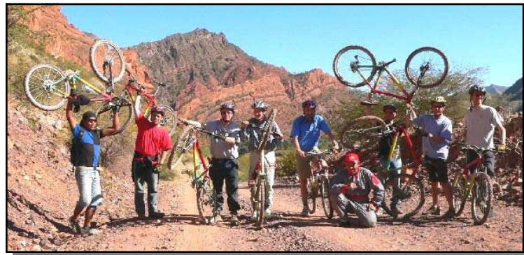
Die abenteuerliche Biking-Tour begeisterte jeden.