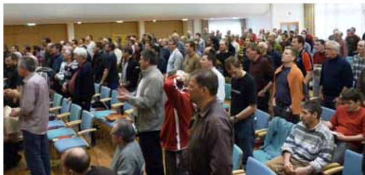
Über 200 Männer nahmen am diesjährigen Männerwochenende im Ländli teil.

Diesmal war es ein spezielles Wochenende. Den allgemeinen Rahmen, den das Ländli-Team ge-