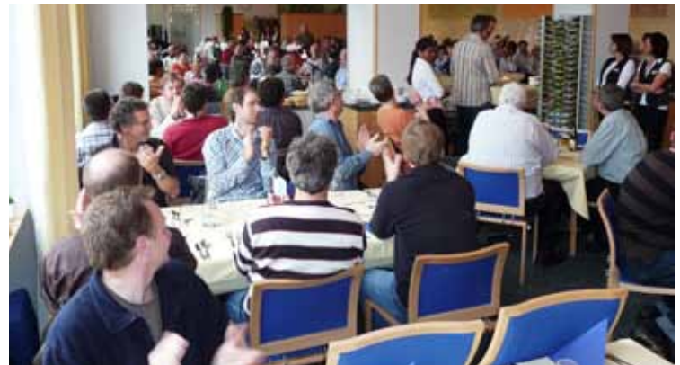
Das Team vom Ländli leistete durch seinen grossartigen Einsatz die Basis, dass sich alle wohl fühlten und die geistlichen Aspekte Raum fanden.

In allem bin ich auf die Gnade des Herrn angewiesen, kann jedoch