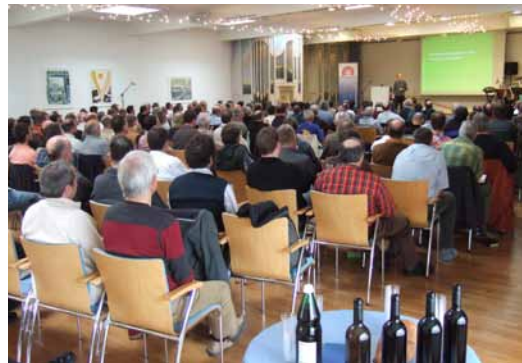
Auch in diesem Wochenende veränderte Gott wieder sehr viele Männerherzen. Die spannenden und bewegenden Erzählungen des Erlebten waren einer der Höhepunkte des Sonntagmorgen. Gott sei Lob und Dank dafür!

Nun waren wir Männer gefragt. Eine Entscheidung stand schon an. Welchen Workshop wähle ich, denn die meiste übrige Zeit werde ich dort in der Gruppe verbringen. Persönlich hätte ich mich für verschiedene Themen entschieden, und das ging manch einem anderen auch so. Wel-