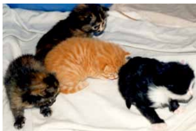
Einige Tage nach der Geburt. Pino rechts vorne!

nehmen, auf schlechten Grund kommen und schlussendlich austrocknen. Das Schicksal dieser Schnecken ist Sinnbild dafür, was passiert, wenn wir den falschen Weg einschlagen. Dieser kann durchaus tödlich sein, insbesondere in Bezug auf die Ewigkeit.