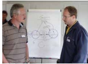
Persönliche Gespräche sind ein wichtiger Teil des Leitertrainings.

Der neue Seminarort auf der Meielisalp ist bestens geeignet und trägt sicher zum Gelingen dieses Wochenendes bei. Du bist mit