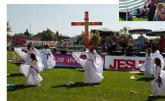
Stadtgottesdienst der Winterthurer Allianz vom 22. Aug. 2010.

ein Zeugnis für die Menschen in unserer Stadt, wie in Johannes 13, 35 steht: «Eure Liebe zueinander