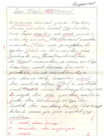
Immerhin schaffte ich es, dass eine ganze Zeile ohne Fehler war!

soll sein, positive Veränderungen in meinem Leben zuzulassen. Ich will offen dafür sein, dass Gott an mir arbeitet und sich nach seinen Vorstellungen formt.