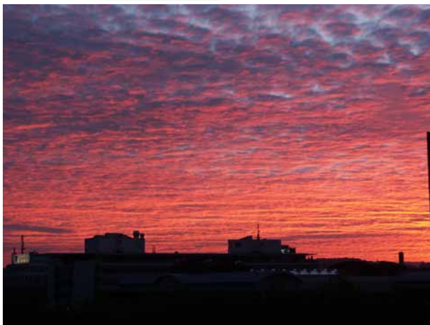
Morgenrot am 13. September 2004 von meinem Büro aus fotografiert.

die der Glaube an Christus Jesus schenkt! Die ganze Schrift ist von Gottes Geist eingegeben und kann uns lehren, was wahr ist, und uns erkennen lassen, wo Schuld in unserem Leben ist. Sie weist