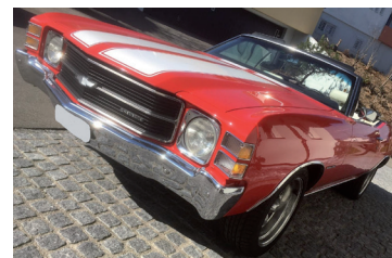
(Chevrolet Chevelle Convertible)

Und wenn dabei etwas repariert werden soll, dann repariert es gefälligst! Es wird euer Beziehung zu Gott, zu all euren Mitmenschen und selbstverständlich auch euch selbst zugutekommen. «Wer also meint, er stehe fest und sicher, der gebe Acht, dass er nicht zu Fall kommt» (1 Kor 10,12).