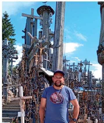
Berg der Kreuze in Litauen

Nach einer Dusche (der ersten seit langem) und einem ausgedehnten Frühstück, fahre ich weiter. Nach der Besichtigung des gefluteten Gefängnisses in Rummu geht es weiter auf die Insel Hiiumaa. Ich wandere auf dem Sääretirp, einer Landzunge, die immer schmaler wird und schliess-