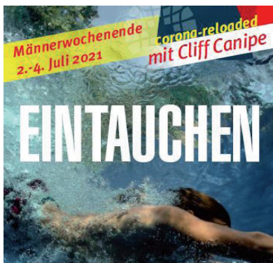
Den neusten Flyer (in der Beilage und auf der Homepage) und weitere Informationen findest du unter www.maennerforum.ch

Dabei sind wir uns durchaus bewusst, dass einige Kantone zu diesem Zeitpunkt bereits in die Sommerferien gestartet sind. Wir möchten jedoch versuchen, an der Durchführung dieses für Männer wichtigen Anlasses festzuhalten. Cliff freut sich darauf, uns Männer für einmal auch durch ein sommerliches Männerweekend begleiten zu dürfen und die Theorie aus unserem Hauptthema mit einem Sprung ins kühle Nass des Ägerisees in die Praxis umzusetzen.